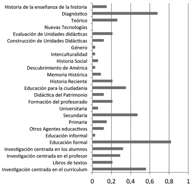
Gráfico 1. Comparación de media de producción de tópicos y temáticas

La producción científica de Didáctica de la Historia en el ámbito de la educación chilena comienza a aumentar exponencialmente desde año 2007. Sobre el total de publicaciones encontradas, sólo el 17'6% se concentra hasta el 2006. Es a partir de entonces cuando la productividad aumenta, siendo el 2012 el año más prolijo, cuando se publicaron un 23'5% de las publicaciones sobre el total.